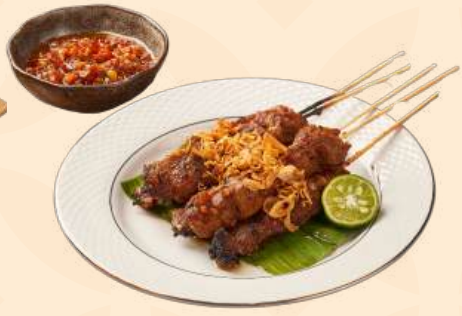
Sate Rembiga 🍴 150 Gr Daging sapi disajikan dengan bumbu khas lombok, sambal bawang, red radish, bawang goreng, jeruk limo