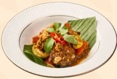
Baramundi Nyat - Nyat Khas Kintamani 130 Gr Kakap putih disajikan dengan bumbu khas kintamani