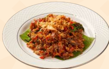
Cakalang Pampis 🍴 120 Gr Cakalang asap yang disajikan dengan bumbu khas dari manado, kemangi, bawang goreng