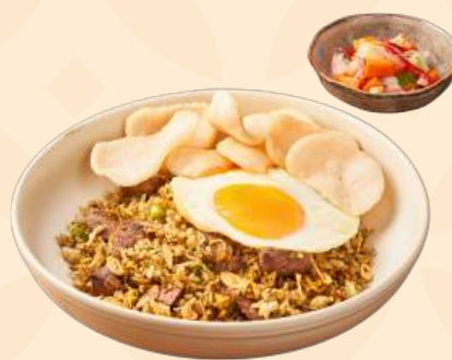
Nasi Goreng Kambing 🍴 Nasi goreng kambing dengan bumbu spesial yang disajikan dengan telur goreng, acar dan kerupuk