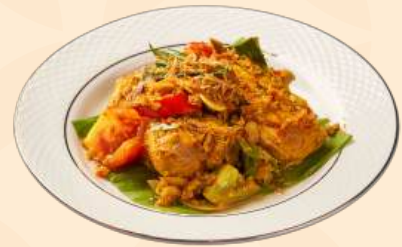
Ayam Woku 🍴 180 Gr Daging ayam yang disajikan dengan bumbu woku khas manado, tomat merah, tomat hijau, kemangi, daun pandan, daun kunyit, daun bawang, bawang goreng, red radish, jeruk sonkit