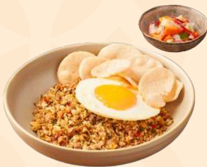
Nasi Goreng Cakalang 🍴 Nasi goreng cakalang khas manado disajikan dengan telur goreng, acar dan kerupuk