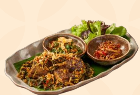
Bebek Betutu 🍴 130 Gr bebek ungkep base genep disajikan dengan sambel matah