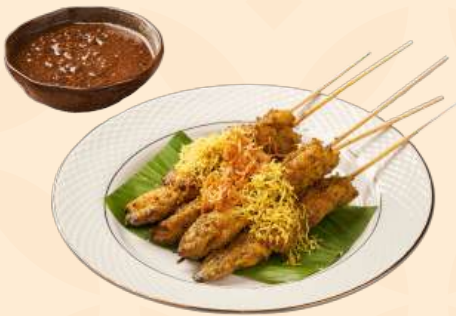
Sate Klopo 🍴 150 Gr Daging ayam disajikan dengan kelapa ,bumbu kacang , red radish dan bumbu klopo khas surabaya