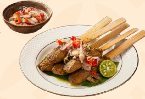
Sate Languan 🍴 150 Gr Daging ikan tongkol disajikan dengan bumbu khas bali, sambal matah khas bali, red radish, jeruk limo